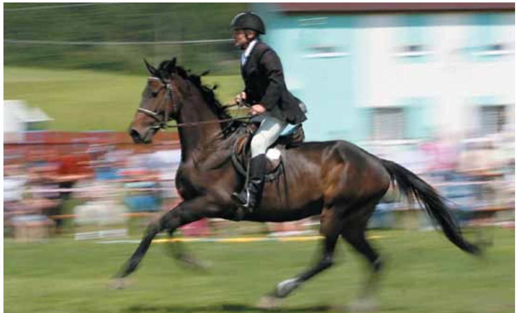
jazdecké preteky - 43. ročník Štiavnickej podkovy