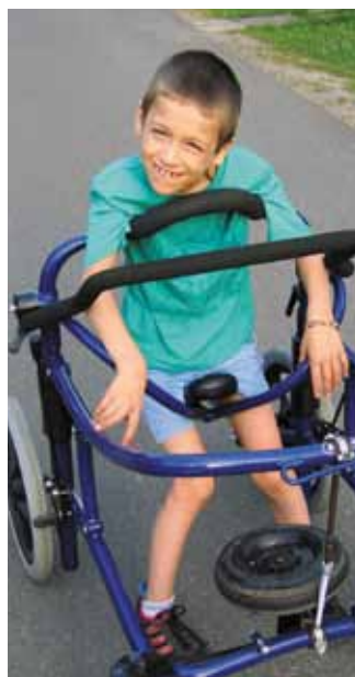
Šimonko s Chodítkom