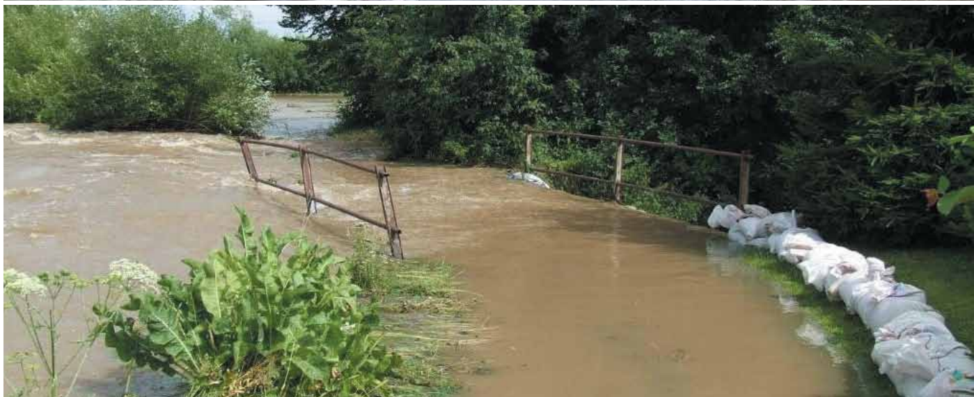
...a voda opäť vyčíňala...