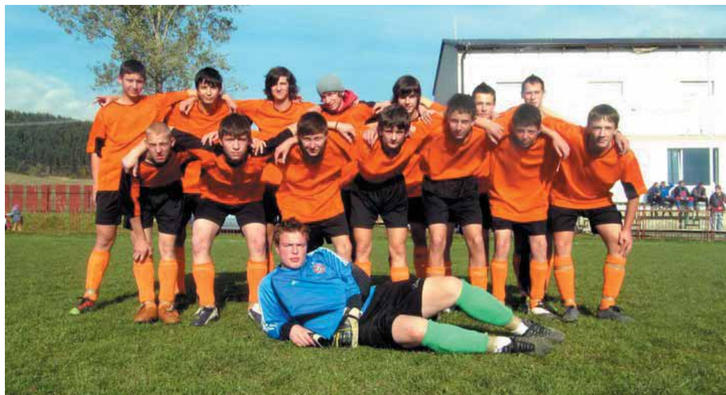
Družstvo dorastu