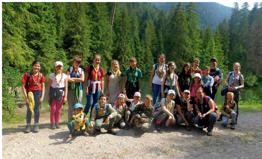
Skauti na výlete