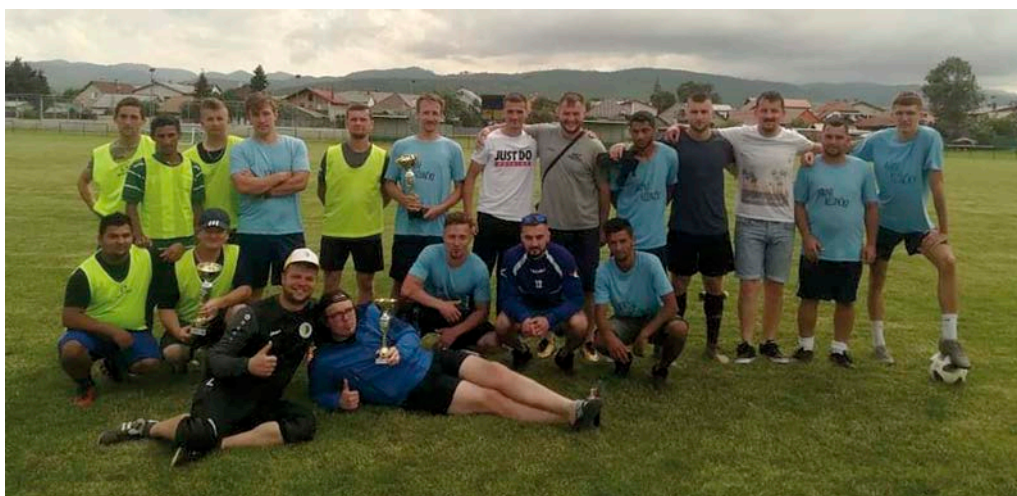
Účastníci futbalového turnaja