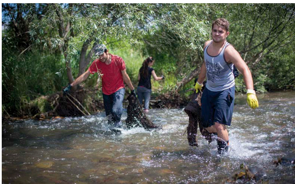
Čistenie Hornádu