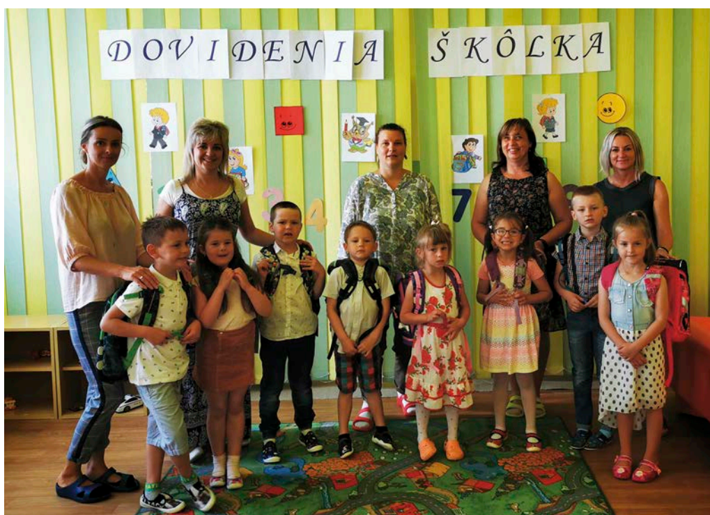
Predškoláci s p. učiteľkami

„Nech sa vám, naši šikovníci, V škole dobre píše a ľahko počíta a tešíme sa, že nám prídete o svojich úspechoch porozprávať“. dovidenia kamaráti, mali sme vás radi!